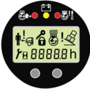
ON BOARD DIAGNOSTICS